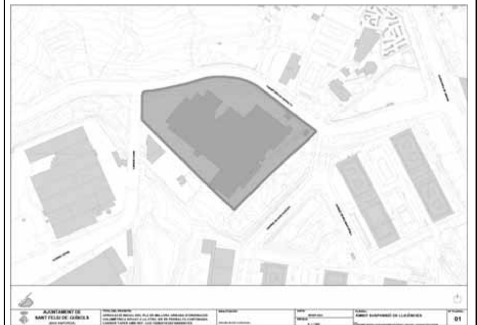
Plànol 01.- "Àmbit de suspensió de llicències Pla de millora urbana SMU-28 Mascanada Llevant"

Plànol 01. - "Àmbit de suspensió de llicències Pla de millora urbana d'ordenació volumètrica de la finca situada a la carretera de Pedralta cantonada Carrer Taper"